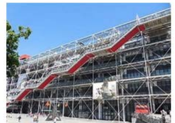
ボンビドー・センター (国立近代美術館)