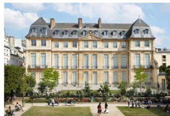
パリにあるピカソ美術館